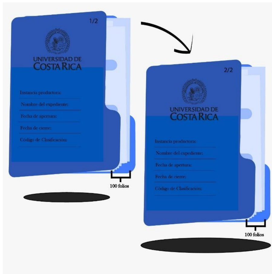
Figura 1 Identificación de carpetas